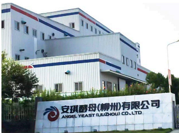
Angel Yeast Co., Ltd

Under 2012 blev DST Kinas kontor i Wuhan kontaktad av Kinas största jästproducent: Angel Yeast Corporation. Deras förväntade produktion beräknas till 20 000 ton per år, huvudsakligen bestående av högaktiv torrjäst. En produktionslinje kontrolleras till absolut fuktighet på 2 g/kg. Angel Yeast var främst fokuserade på att upprätthålla konstant klimat, med tonvikt på tillförlitlighet på de maskiner som används. Kunden hade upplevt alltför många produktionsstopp på grund av otillräcklig och dålig kvalitet av maskiner i det förflutna och var angelägna om att undvika att upprepa det och att få en mer effektiv produktion.