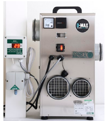
EH4 sekä huoneanturi liitettynä kuivaimeen DR-10B

Varamme oikeuden muutoksiin niistä ennalta ilmoittamatta