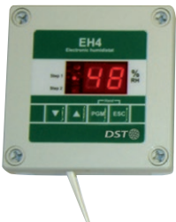
Näyttö: RJ9 kaapeli, matalajännite, 25m. Jatkokaapelisarja, (max. 200m).

Lisätarvikkeet: Erillinen näyttö. Näyttö ja näppäimistö voidaan siirtää matalajännitekaapelin avulla 25m päähän.