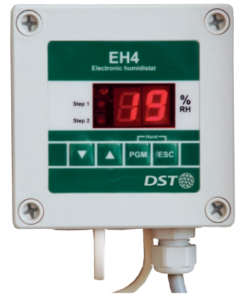
EH4 ja vakio huoneanturi, IP65. Huoneanturi: RJ9 matalajännitejohto, 3m. Lisäsarja: 25m RJ9 johtoa (max 50m)

Lisätarvikkeet: Erillinen näyttö. Näyttö ja näppäimistö voidaan siirtää matalajännitekaapelin avulla 25m päähän.