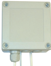
Rele: 230 V syöttö